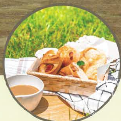
モーニングサービスあります